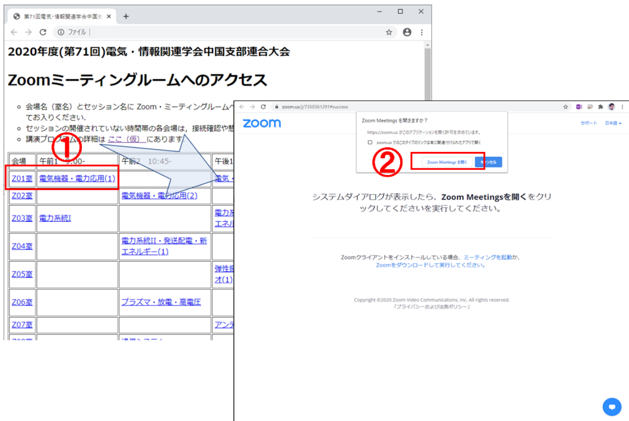
図 2 Zoom ミーティングルームへの接続